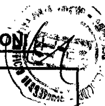
Quadro delle risorse relative alle funzioni trasferite e delegate per il 2004