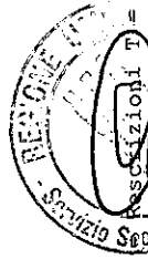
Tabella T - Riclassificazione della spesa per sezione e categoria economica