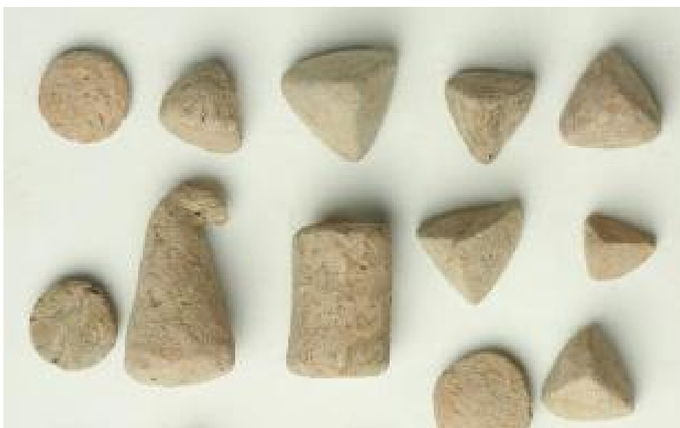
Alcuni gettoni d'argilla ritrovati a Ziyaret Tepe, in Turchia

Unità Operativa Amministrativa Sezione Contabilità e Controllo di Gestione